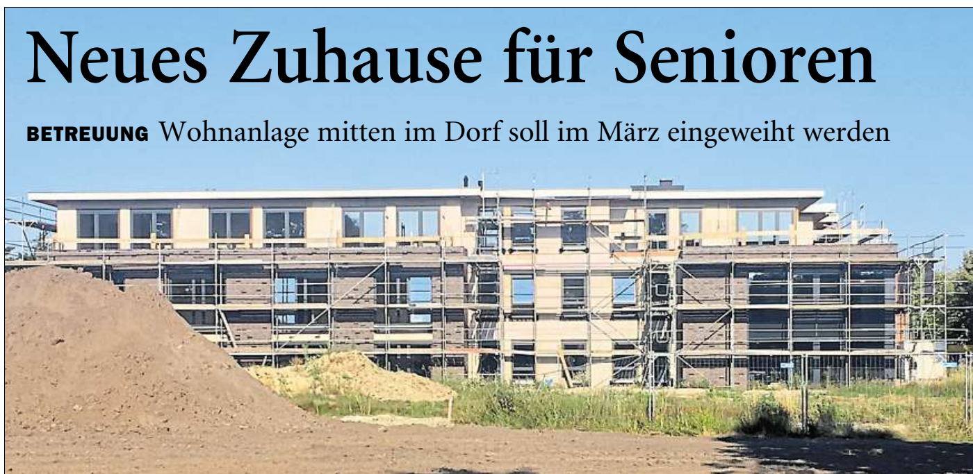
Neubau an der Straße Osterende: In Apen entsteht mitten im Dorf das erste Seniorenzentrum.