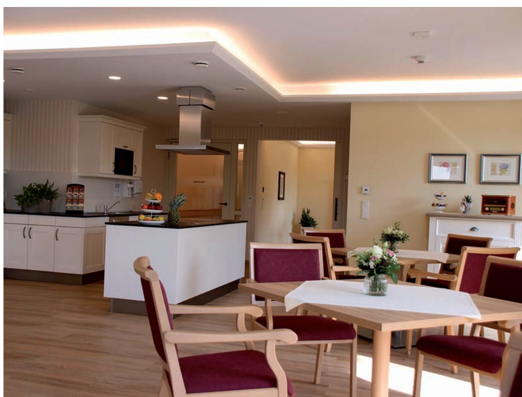
Raum der Tagespflege